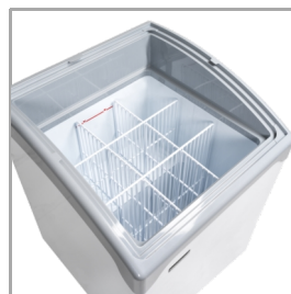
Sistem za ločevanje