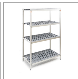
Polica kot dodatek