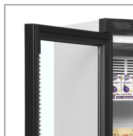
LED-luč v okvirju vrat