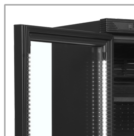
LED-luč v okvirju vrat