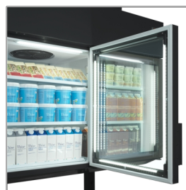
LED-luč v okvirju vrat