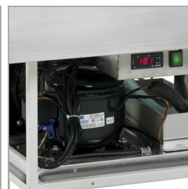
Samodejno izparevanje odtaljene vode