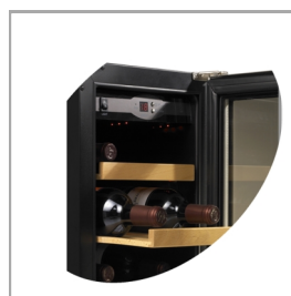
Lesene izvlečne police