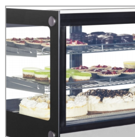
Vitrina za pecivo